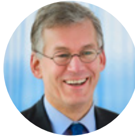
Frans van Houten, CEO Philips, Comité van aanbeveling FNL

“Natural leadership has enabled me to become a more effective leader. I’ve gained better insights through deeper observation and inquiry and this has led to more effective connections between people. This holistic approach to what we do and the impact we have on the world around us helps the integration of “head, hand and heart” in how we act and lead. I also seek out the natural leaders among my own talent pool: who has the best insights? Who builds the most effective networks? The best